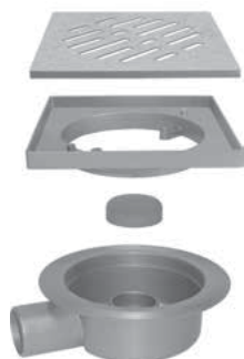
Esploso dei componenti