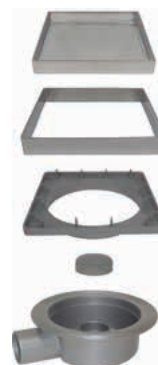
Esploso dei componenti