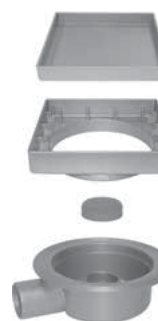
Esploso dei componenti

Il chiusino porta piastrella permette di utilizzare una piastrella come chiusino. In questo modo si migliora notevolmente l'impatto visivo. Materiale: - Corpo e sifone in ABS. - Portapiastrella in acciaio Inox AISI304 e ABS.