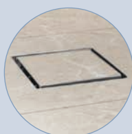
Esempio di utilizzo del chiusino porta piastrella