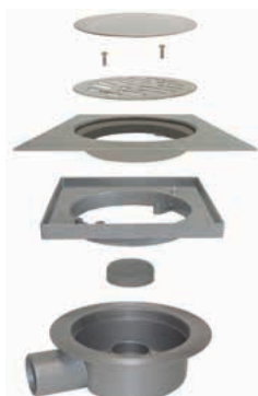
Esploso dei componenti