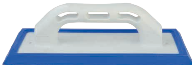
FRPLAINTON-01 Frattoni spargibuiacca