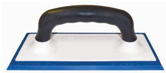
FRPLAINTON-01B Frattoni spargibuiacca monoblocco

Prodotto da GRUPPO STAMPLAST, il frattone spargibuiacca è utilizzato nella posa in opera della buiacca. Tutti i frattoni si possono personalizzare anche con codice a barre.