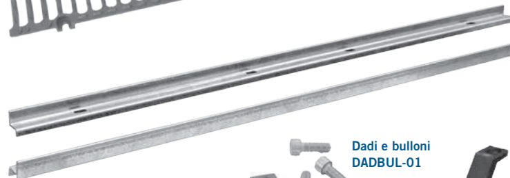
Longherone zincato LONGHERONE20-01