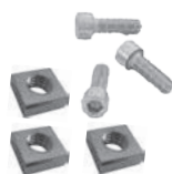
Dadi e bulloni DADBUL-01