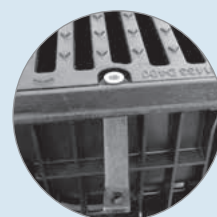
Montaggio della zanca