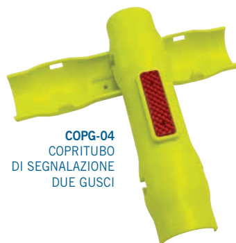
COPG-04 COPRITUBO DI SEGNALAZIONE DUE GUSCI