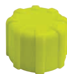
TPONT-01 TAPPO DI PROTEZIONE PONTEGGIO RIGIDO