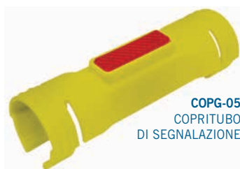
COPG-05 COPRITUBO DI SEGNALAZIONE