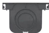
Tappo Scarichi: Ø 50 e Ø 75

CANALETTA INDIVIDUAL "SUPER TOP" 13 X 100