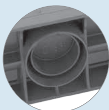
Scarichi laterali H 7,5: scarico Ø 50 - 63 H15: Scarico Ø 80 - 100 - 110