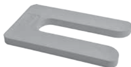
PIASTRAU Piastra ad U 125x75mm