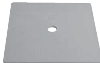
PIASTRAQ05 Piastra robus quadra h5mm