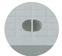
Elemento di presa del chiusino