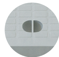
Elemento di presa del chiusino