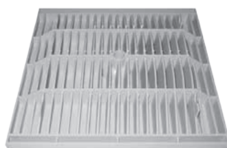
Vista struttura inferiore