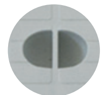
Elemento di presa del chiusino