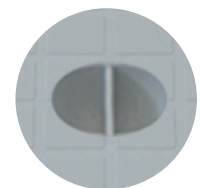
Elemento di presa del chiusino