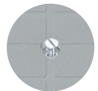
Dettaglio apertura con bullone sul modello 55x55 cm