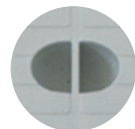
Elemento di presa del chiusino