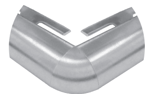
Modo di installazione capsula tonda