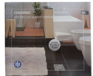
Prodotto confezionato singolarmente