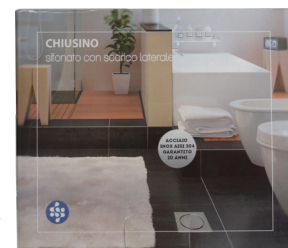
Prodotto confezionato singolarmente