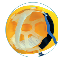
Vista interna dell'elmetto