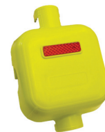
COPG-03 COPRIGIUNTO PER PONTEGGI MULTIDIREZIONALI