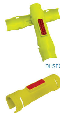
COPG-04 COPRITUBO DI SEGNALEZIONE DUE GUSCI