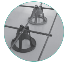
Esempio di applicazione