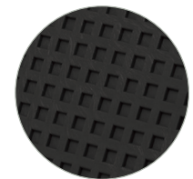
Piano levigatore del Frattone in plastica