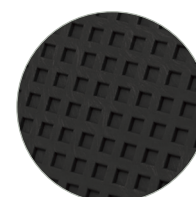
Piano levigatore del Frattoni in plastica