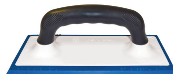
FRPLAINTON-01B Frattone spargibuiacca monoblocco

Prodotto da GRUPPO STAMPLAST, il frattone spargibuiacca è utilizzato nella posa in opera della buiacca. Tutti i frattoni si possono personalizzare anche con codice a barre.