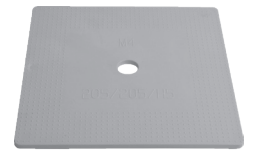
PIASTRAQ05 Piastra robus quadra h5mm

Prodotte da GRUPPO STAMPLAST, le piastre e gli spessori permettono di ridistribuire le pressioni di contatto su di un'area sufficientemente ampia nel montaggio dei pannelli prefabbricati.