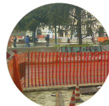
Esempio di utilizzo della recinzione cantiere