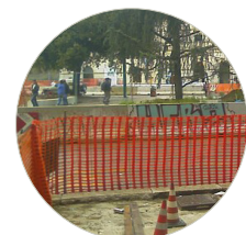
Esempio di utilizzo della recinzione cantiere