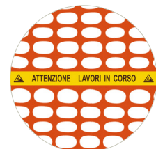
Banda di segnalazione